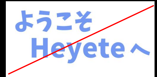
文章の一部として使うこと