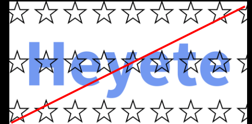
ロゴの視認性に著しくかける